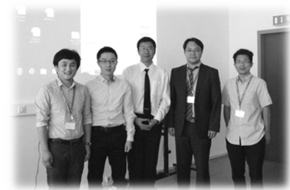
青年化学奖颁奖现场（上）